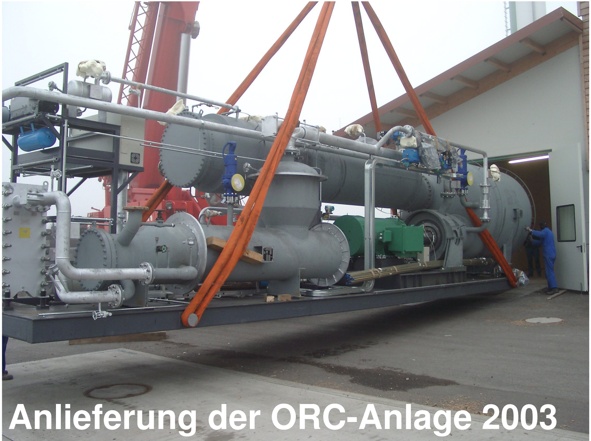
Anlieferung der ORC-Anlage 2003